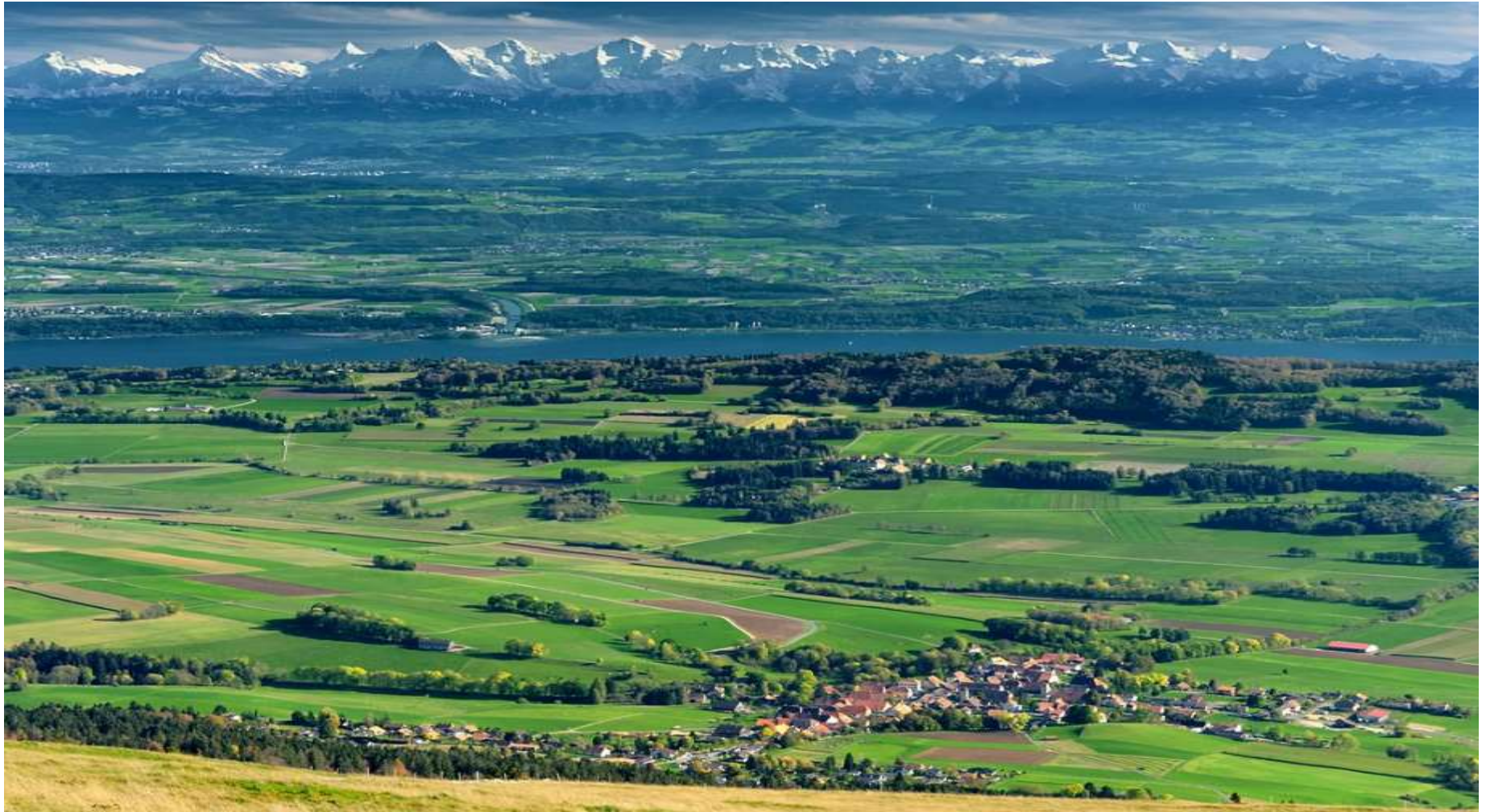
Beeld vanaf de Chasseral (1607m) in zuidoostelijke richting