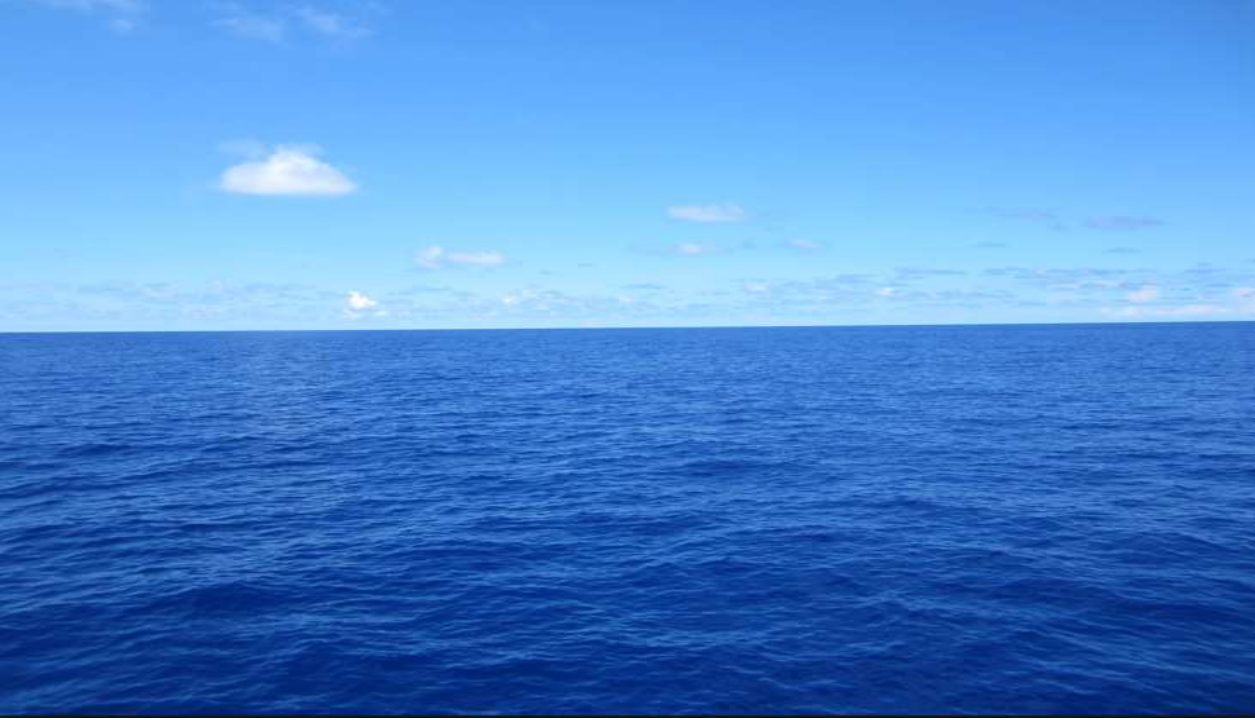
Alpine oceaan of Piemond- en Ligurische oceaan